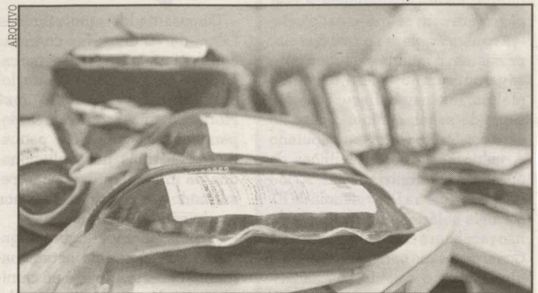
Número de bolsas de sangue estocadas costuma cair de 30 a 50% no Carnaval

De acordo com um balanço divulgado pelo Governo do Estado, a quantidade de sangue disponível nos bancos cai de 30% a 50% nesta época do ano. No Hemonúcleo de Santos, por exemplo, são reservados, em média, 300 bolsas de sangue por mês. No Carnaval, porém, essa quantidade cai para pouco menos de 200 e diminui a variedade de tipos.