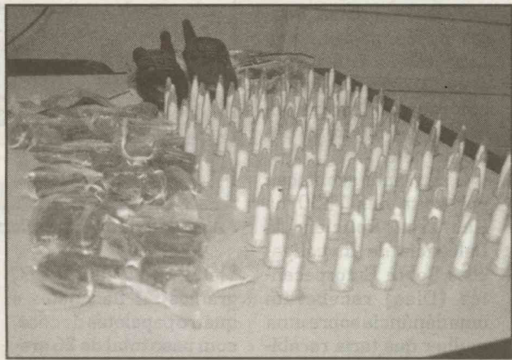
Foram encontradas 113 porções de cocaína e 40 de maconha

Os suspeitos foram vistos em frente a uma árvore sendo abordados por uma pessoa. Após breve conversa, ela teria entre-