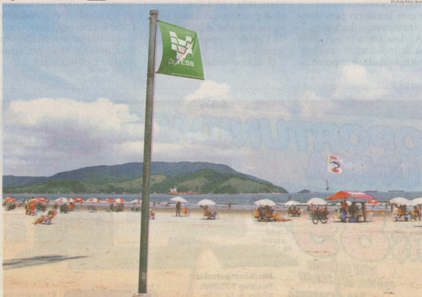
Em Santos, as amostras de água do mar são colhidas sempre às segundas e quartas-feiras

O Laboratório de Controle Ambiental é aberto ao público. Estudantes e demais interessados podem agendar visita monitorada pelo telefone 3289-3674. O horário de funcionamento é de segunda a sexta-feira, das 8 às 12 h e das 14 às 18 h. Aos sábados e domingos, das 10 às 15 h.